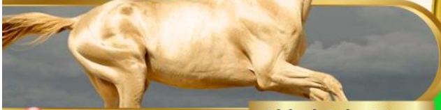
Akhal Teke Horse