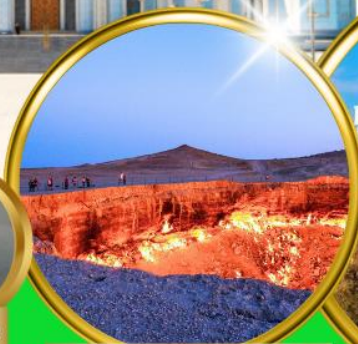
Darvaza Gate To Hell