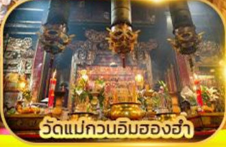
วัดแม่กวนอิมสองห้า