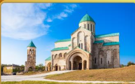
มหาวิหารบากราติ