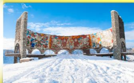
อนุสรณ์สถานรัสเซีย