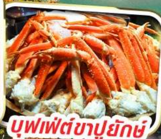
บุฟเฟ่ต์ซาปูยักษ์