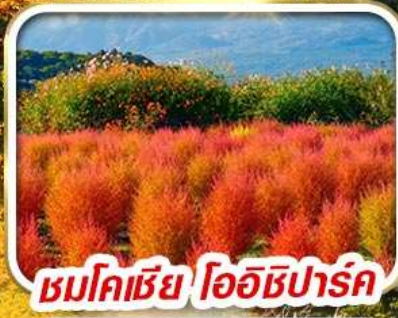
ชมโคเชีย โออิชิปาร์ค