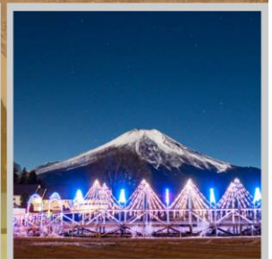
"YAMANAKAKO ILLUMINATION FANTASEUM"