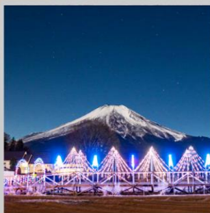
“YAMANAKAKO ILLUMINATION FANTASEUM”