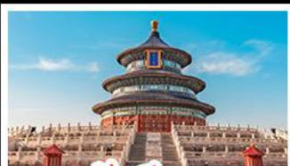
เจ้อฟ้าเทียนถาน

พระราชวังต้องห้าม - หอฟ้าเทียนถาน พิพิธภัณฑ์บิรซิงเต่า - ไรไวน์ - วาฬเคียวคาย