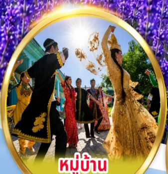
หมู่บ้าน วัฒนธรรมอุยกูร์

พิเศษ นั่งรถม้า + ซิมไอศกรีมอุยกูร์ ชมการแสดง