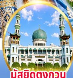
มัสยิดตงกอน