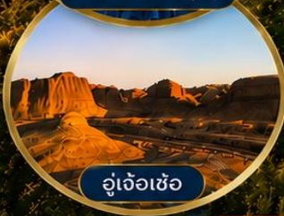
อู๋เจ้อเซ่อ