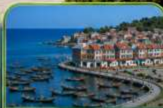
หมู่บ้านประมงซาจื่อไ่