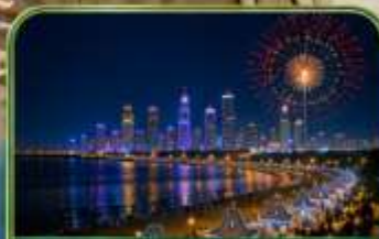
NO 3 Bathing Beach ชมไฟกลางคืน