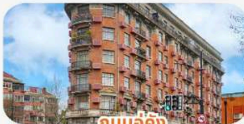
ถนนอูคัง