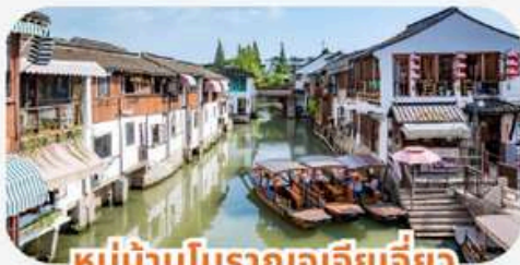
หมู่บ้านโบราณอูเจียเจียว