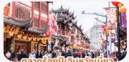
ตลาดร้อยปีเดินหวังเมี่ยว