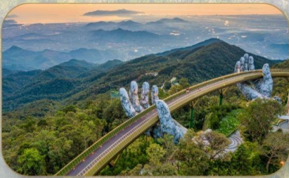
สะพานมือทองคำ