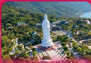
องค์กวนอิม วัดหลินอึ้ง