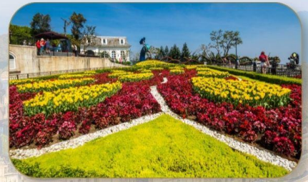
สวนดอกไม้ Le Jardin D'Amour