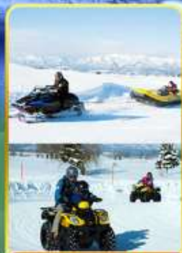
BIBAI SNOW LAND