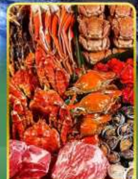
ปิ้งย่างพรีเมียมมันตะ

🍷 ออนเซ็น 2 คั้น 🧳 มน.กระเป๋า 1 ใบ 23 กก 🌞 7Days 5Night