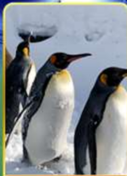
พาเหรดกเพนกวิน