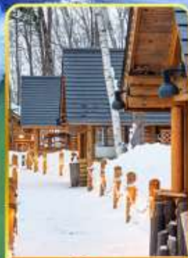
มิงเกิ้ลทอเร