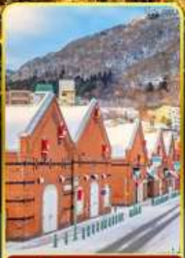
โกดังอิฐแดง