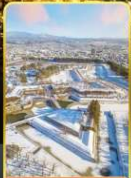
หอดาวห้าแฉก

🔥 ออนเซ็น 3 คั้น 🧳 มน.กระเป๋า 1 ใบ 23 กก 🌞 7Days 5Night