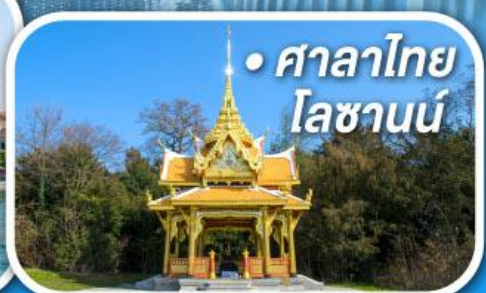
• ศาลาไทย ไอซานน์

• สุดอากาศดีดีที่เซอร์แมท • ขึ้นกระเช้าสู่ยอดจากกลาเซียร์ 3000 • ชมเมืองคลาสสิกเบิร์น ลูเซิร์น ซูริก