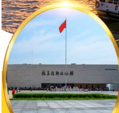
พิพิธภัณฑ์สงคราม เกาหลีตานตง