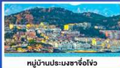
หมู่บ้านประมงซาโจ้ว