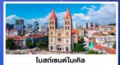
โบสถ์เซนต์โมเกิล