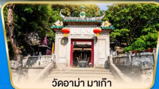
วัดอามา มาเก๊า