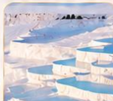
PAMUKKALE ปานุกคาล่า