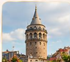
GALATA TOWER หอคอยกาลาตา