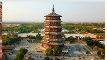
วัดเจดีย์ไม้ มู่ตา

*ทางบริษัทฯ ขอสงวนสิทธิ์ในการสลับโปรแกรมทัวร์ตามความเหมาะสมขึ้นอยู่กับสถานการณ์หน้างาน โดยคำนึงถึงผลประโยชน์ของลูกค้าเป็นสำคัญ