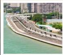
สะพานเหยียนหู่เฉียว