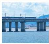
นั่งรถไฟใต้ดินข้ามทะเล