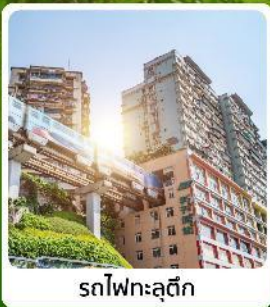
รถไฟกะลุดัก

ไฮไลท์! เมืองโบราณกงถาน ล่องเรือแม่น้ำจูเจียง อุทยานถ้ำอาผยอง รถไฟกะลุดัก หมู่บ้านโบราณฉือซีโซ่ ดนขบคนเดินเรือฟางเปีย