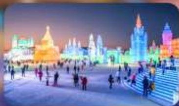
เทศกาลน้ำแข็งฮาร์บิน