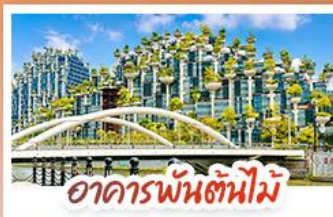
อาคารพันตันใหม่