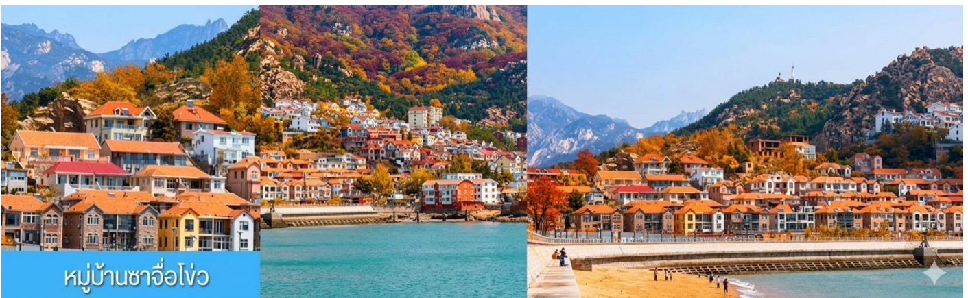
หมู่บ้านชาวจิวไห่