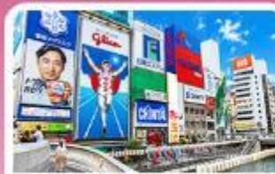
ชิบโซนาชิ