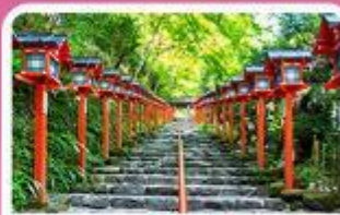
ศาลเจ้าคิฟูเนะ