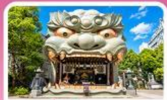
ศาลเจ้านิมมะ ยาซากะ