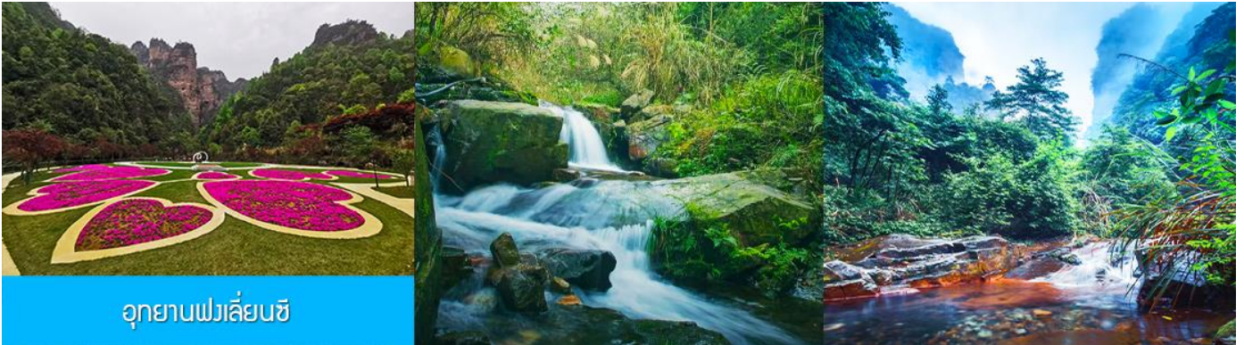
อุทยานฟงเลียนซี