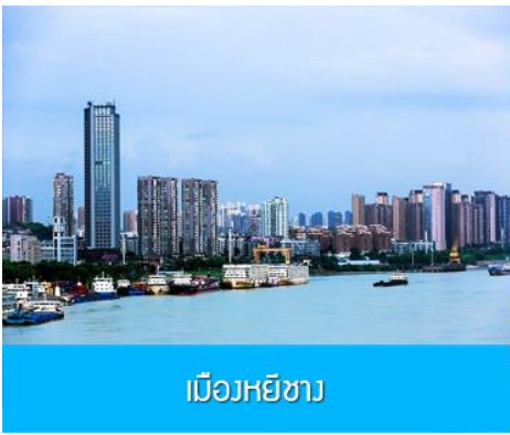
เมืองหยี่ชาง