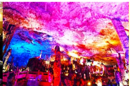
ถ้าแก้วสวรรค์วิวเทียนต้ง