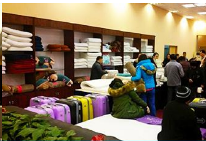
ศูนย์จำหน่ายผลิตภัณฑ์ยางพารา