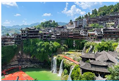
เมืองโบราณ ฝูหรงเจิ้น