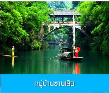
หมู่บ้านชานเสี