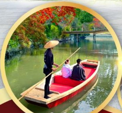
กิจกรรมล่องเรือยามากาวะ