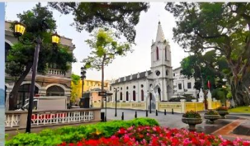
เกาะชาเมี่ยน