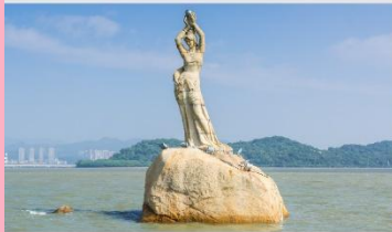
จู่ไห่พีชเชอร์เกิร์ล(หวีหนี่)