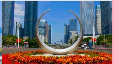
จัตุรัสฮั่วเจิง

*ทางบริษัทฯ ขอสงวนสิทธิ์ในการสลับโปรแกรมทัวร์ตามความเหมาะสมขึ้นอยู่กับสถานการณ์สำนักงาน โดยคำนึงถึงผลประโยชน์ของลูกค้าเป็นสำคัญ