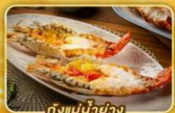
กุ้งแม่น้ำย่าง