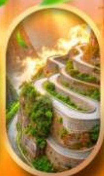
หุบเขาป้ายจ้าง