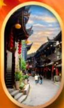
เมืองโบราณฟูหลงเจี้ยน