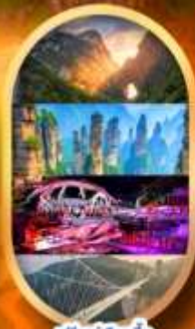
ฟรีเดย์เลือกซื้อ Option เสริม