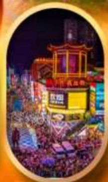
ถนนคนเดินซิงลู่