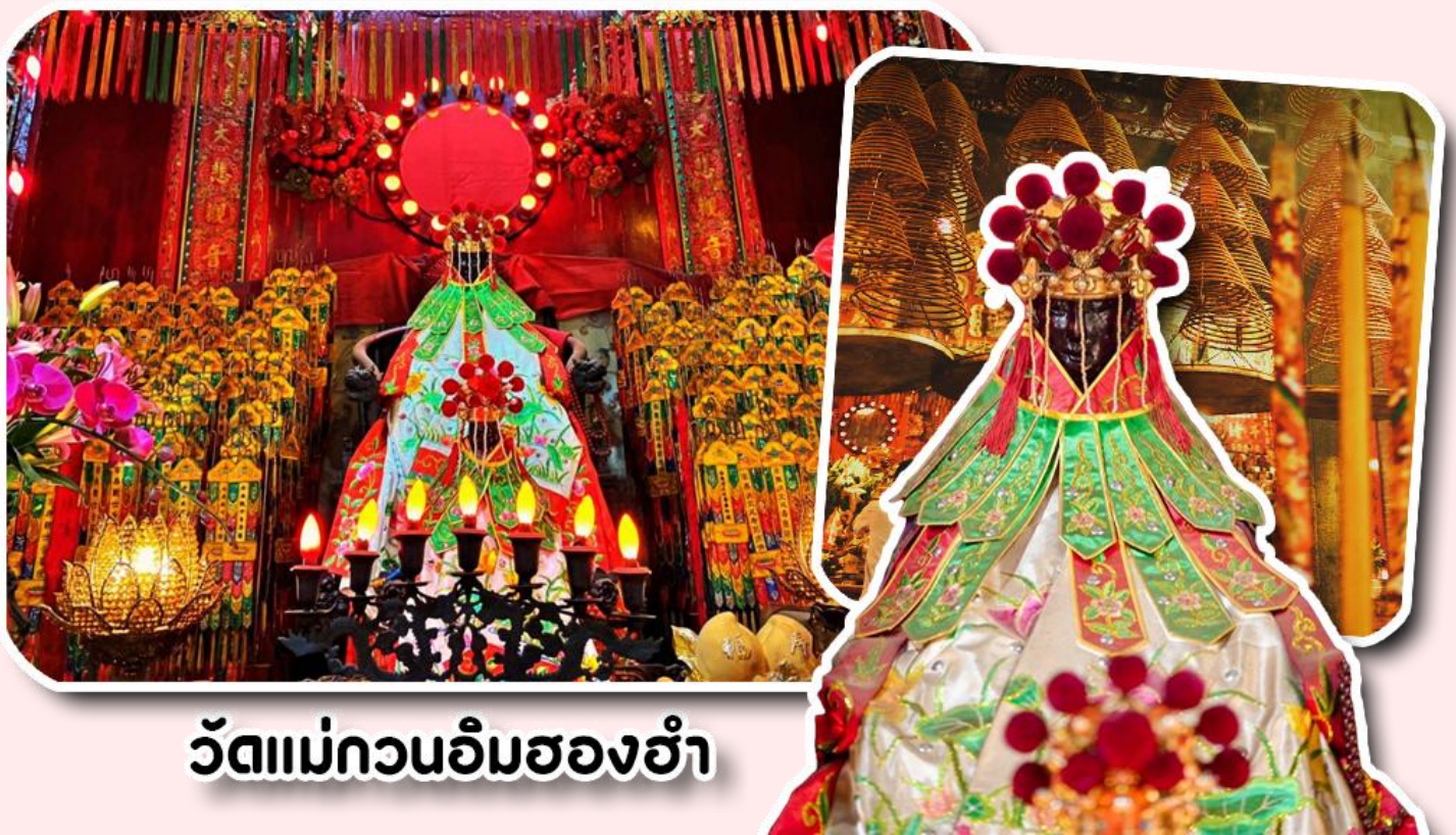
วัดแม่กวนอิมฮ่องกง

1873 เป็นวัดขนาดเล็กที่มีชาวฮ่องกงศรัทธาแน่นถือกันเป็นอย่างมาก วัดแห่งนี้เป็นที่ประดิษฐาน องค์เจ้าแม่กวนอิมฮ่องกง ที่มีชื่อเสียงเรื่องการให้กู้ยืมเงิน เชื่อกันว่าท่านช่วยพลิกฟื้นเศรษฐกิจของชาวฮ่องกง ผู้คนจึงนิยมมาเยี่ยมเงินทำธุรกิจจนสำเร็จร่ำรวย รุ่งเรือง โดยให้ท่านอธิษฐานขอพรต่อหน้าเจ้าแม่กวนอิมฮ่องกง พร้อมกับระบุวันเวลาในการขอพรด้วย จากนั้นนำธูปตามฐานะและศรัทธาที่เราจะนำเป็นสื่อในการขอพร เขียนจำนวนเงินที่ต้องการลงไปด้วย ใสสกุลเงินยิ่งดีใหญ่ แล้วนำเงินใส่ในซองแดง ควรเตรียมซองแดงไปเอง นำซองแดงไปวนรอบกระถางธูป วนขวาจำนวน 3 ครั้ง แล้วเก็บซองแดงในกระเป๋าสตางค์ เป็นเงินขวัญถุง ถ้าประสบความสำเร็จตามที่มุ่งหวัง ให้นำเงินในซองแดงทำบุญหยอดตู้ที่วัดแห่งนี้ในโอกาสต่อไป วิธีไหว้ให้ปัง ให้ได้โชคลาภเงินทอง ต้องไปกับเราเท่านั้น