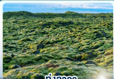
ทุ่งลาวา