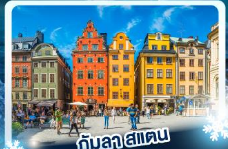
♨️ กับลาสแตน