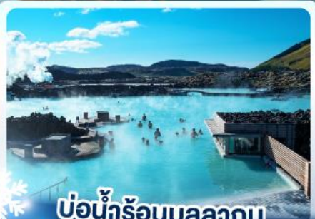
♨️ แช่น้ำร้อนบลูลากูน

เก็บไอซ์แลนด์ แดนภูเขาไฟคิรูกูฟลา และ แช่น้ำร้อนบลูลากูน