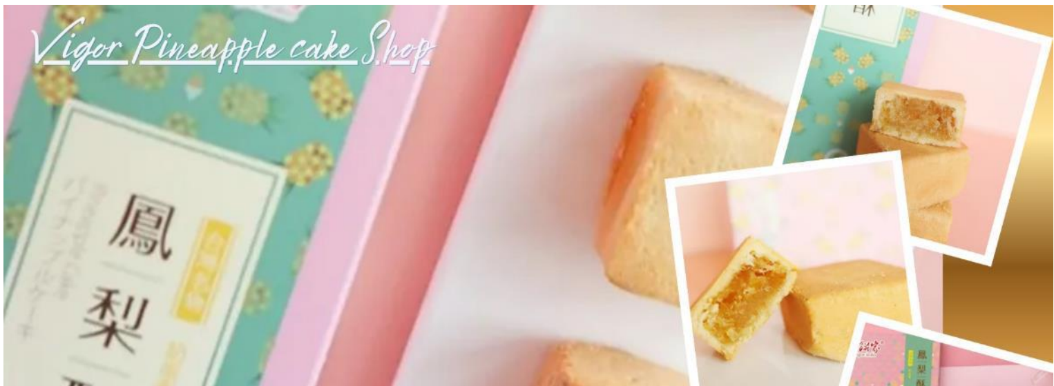
Vigor Pineapple cake Shop

จากนั้นแวะซื้อป๊องร้านพายสับปะรด (Vigor Kobo) สินค้าขึ้นชื่อของไต้หวันที่ได้รับความนิยมระดับสากล อิสระเลือกซื้อเป็นของฝากอามอัธยาศัย