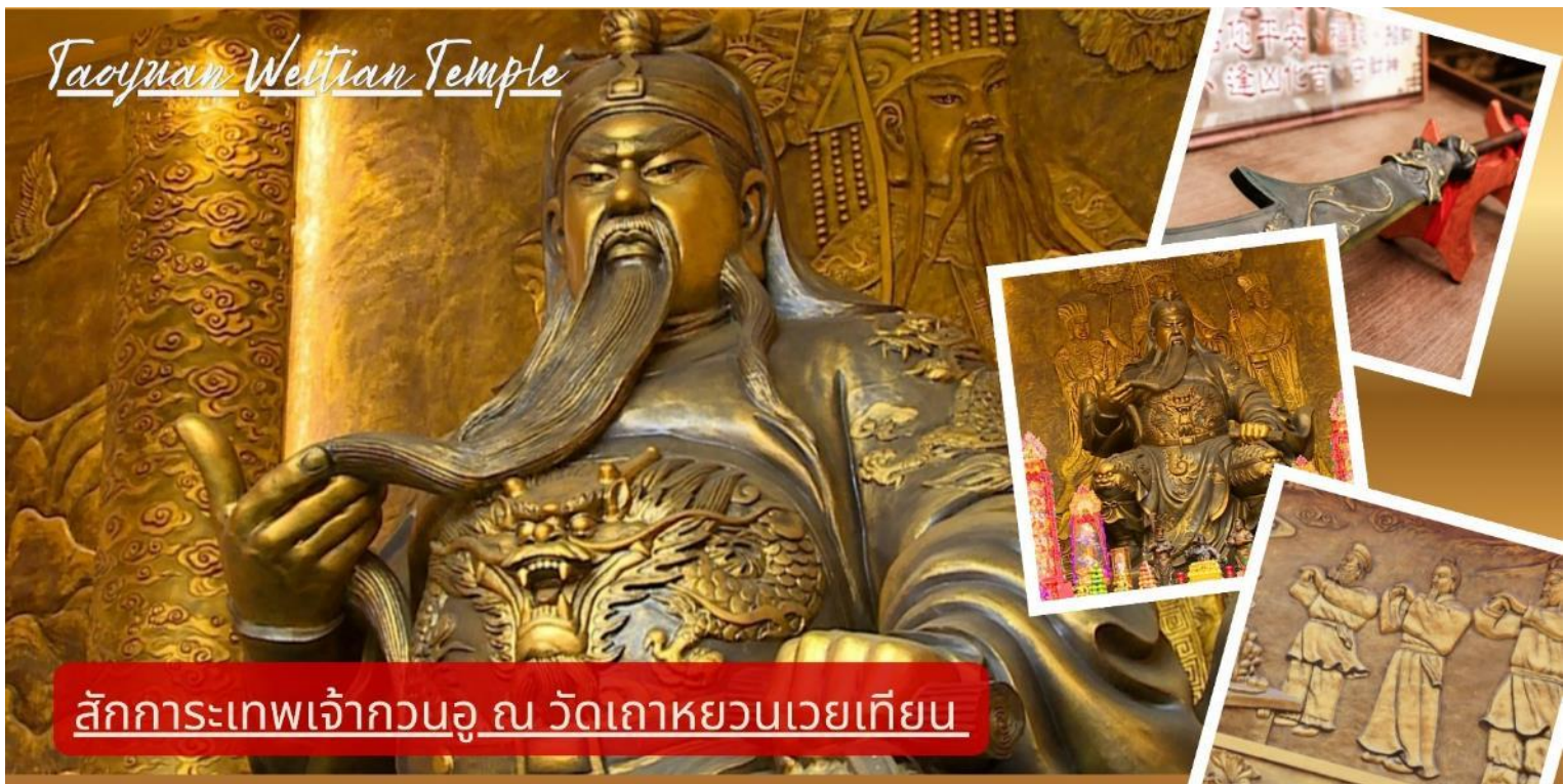
Taoyuan Weitian Temple

สักการะเทพเจ้ากวนอู ณ วัดเกาหยวนเวยเทียน