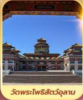
วัดพระโพธิสัตว์อูลาน