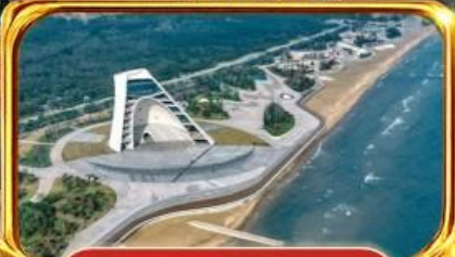
หอดอยกาลเวลา