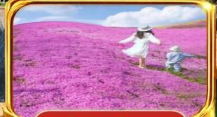
ทุ่งพิงค์มอส