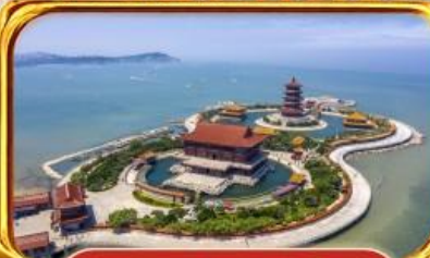
จุดชมวิว 8 เชียง