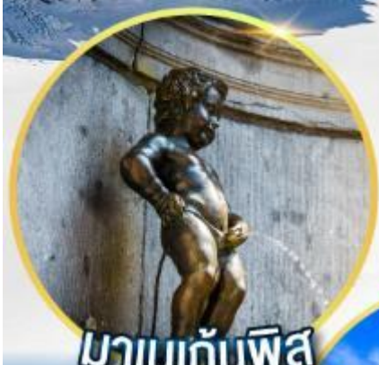
มานกันพิส