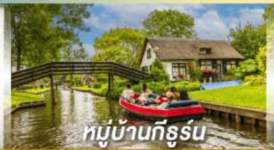
หมู่บ้านทีรูร์น