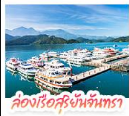
ล่องเรือสุริยันจันทรา

ล่องเรือชมทะเลสาบสุริยันจันทรา (SUN MOON LAKE) ชมเกาะลาลู แวง-วัดสวนกง • อีสระดินล่ม หมู่บ้านอิต้าซ่า • บึงรถไฟลิกโบราณ (1 สถานี) ลิมน์บรรยากาศสันทางรถไฟสายธรรมชาติ • ตะลุย ไทจงไนท์มาร์เก็ต แหล่งรวมแฟชั่นและสตรีทฟู้ด • ซ้อปิ้งย่าน ซิเหมินดิง (XIMENDING) ถ่ายรูปแลนด์มาร์ค ดึกไทเป 101 • ซ้อปิ้งถึงทวงที่ MITSUI OUTLET PARK ชมความสวยงามของ อนุสรณ์สถานเจียงไคเชก • ขอฟรรค์ความรักที่ วัดหลงชาน ชมโศกหินเสี่ยวราซีนี่ที่ เย่หลิว • ชมบรรยากาศเมืองเก่าที่ จิวเฟิน