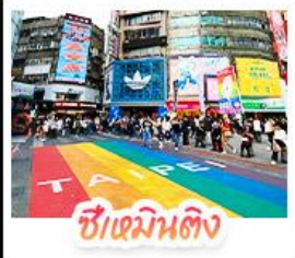
ซีเหมินดิง