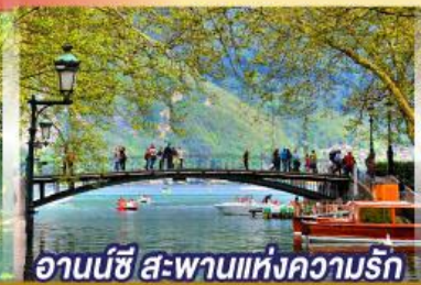
อานนีซี สะพานแห่งความรัก