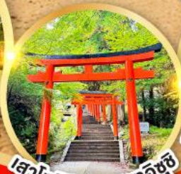
เสาโทริอิ ปราสาทอิซุชิ