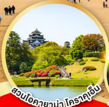
สวนโอคายาม่า โคราคูเอ็น