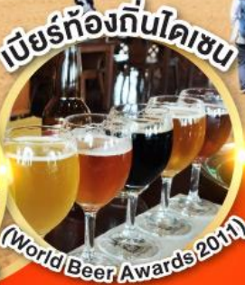
เบียร์ท้องถิ่นโคเชน (World Beer Awards 2011)

นั่งกระเช้าชมใบไม้เปลี่ยนสี ภูเขาโคเชน ฟูจิ แห่ง ทตโตริ