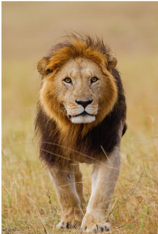
BIG FIVE GAME DRIVE

สัมผัสประสบการณ์สุดตื่นเต้น ชมสัตว์ป่าอย่างใกล้ชิดท่ามกลางธรรมชาติอันอุดมสมบูรณ์ ตื่นตาตื่นใจไปกับ "Big Five" อันเลื่องชื่อ ได้แก่ สิงโต ช้าง แรด ควายป่า และเสือดาว ที่ออกมาใช้ชีวิตอย่างอิสระในถิ่นอาศัยตามธรรมชาติ อีกหนึ่งไฮไลท์ที่ไม่ควรพลาด คือโอกาสในการชมปรากฏการณ์การอพยพของสัตว์ป่าขนาดใหญ่ ซึ่งชวนให้นึกถึงภาพอันยิ่งใหญ่คล้ายของ Maasai Mara National Reserve ที่มีชื่อเสียงระดับโลก