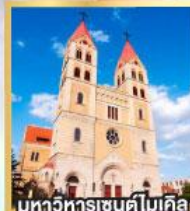
มหาวิหารเซนต์ไมเคิล