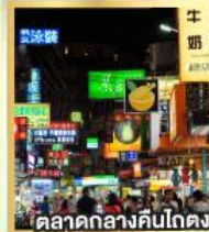
ตลาดกลางคืนโกตง