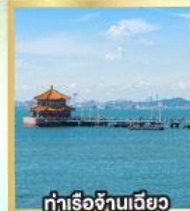
ท่าเรือจันทันเฉียว