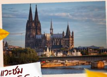
แคว้น มณฑลซาร์ดิเนีย