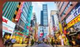
ซ้อปิ้งชินจูกุ