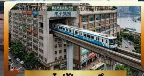
รถไฟฟ้าทะลุติ๊ก