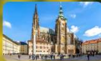
เข้าชม 2 ปราสาท ปราก และเซินบรุนน์