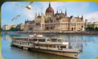
ส่องเรือแม่น้ำดานูบ พร้อมจิบแชมเปญ