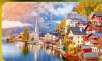
การันตีพัก Hallstatt / St. Wolfgang หรือริมนทะเลสาบ 1 คืน