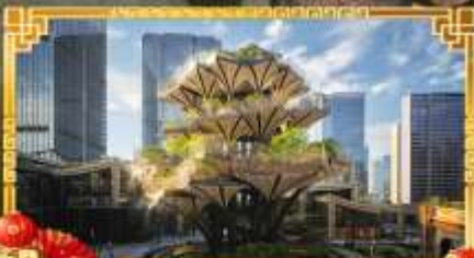
XIAN TREE&MIXC MALL