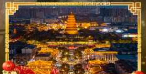
ถนนคนเดินราชวงศ์ถัง