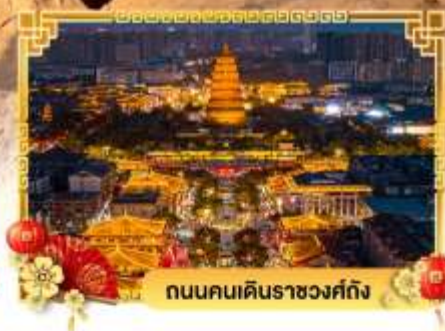
ถนนคนเดินราชวงศ์ถัง

เดินทางโดย: สายการบินสปริงส์แอร์ไลน์ (9C)