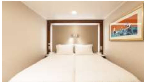
พัก 1-2 ท่าน

From 13 - 14 sq.m Max Occupancy 2-4 + Deck 5/8/9/10/11/12/13/15 2 Single Beds / 2 Single Beds + 1 Ceiling Pullman Bed / 1 Single Bed + 1 Pullman Bed + 1 Double Sofa Bed