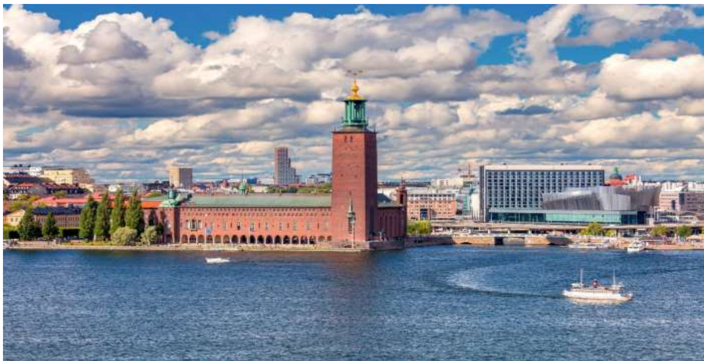
STOCKHOLM CITY HALL

เดินทางถึง ท่าอากาศยานสต็อกโฮล์มอาร์ลันดา ประเทศสวีเดน นำท่านผ่านขั้นตอนการตรวจคนเข้าเมือง และพิธีการทางศุลกากร จากนั้นนำท่านขึ้นรถโค้ชเพื่อเดินทางสู่ “กรุงสต็อกโฮล์ม” เมืองหลวงอันสง่างามของประเทศสวีเดน ซึ่งได้รับการยกย่องว่าเป็นหนึ่งในเมืองหลวงที่สวยงามที่สุดในโลก ด้วยฉายา “ความงามบนผิวน้ำ” (Beauty on Water) และ “ราชินีแห่งทะเลบอลติก” (Queen of the Baltic) นับเป็นเอกลักษณ์อันทรงเสน่ห์ที่ไม่เหมือนที่ใดในโลก จากนั้นนำทุกท่านเข้าสู่ การเยี่ยมชม ศาลาว่าการเมืองสต็อกโฮล์ม (Stockholm City Hall) ซึ่งเป็นสถานที่จัดงานเลี้ยงอันทรงเกียรติสำหรับผู้ได้รับรางวัลโนเบล