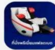
ที่นั่งพรีเมียมเฟลทเบด