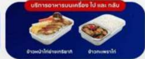
บริการอาหารบนเครื่อง ไป และ กลับ