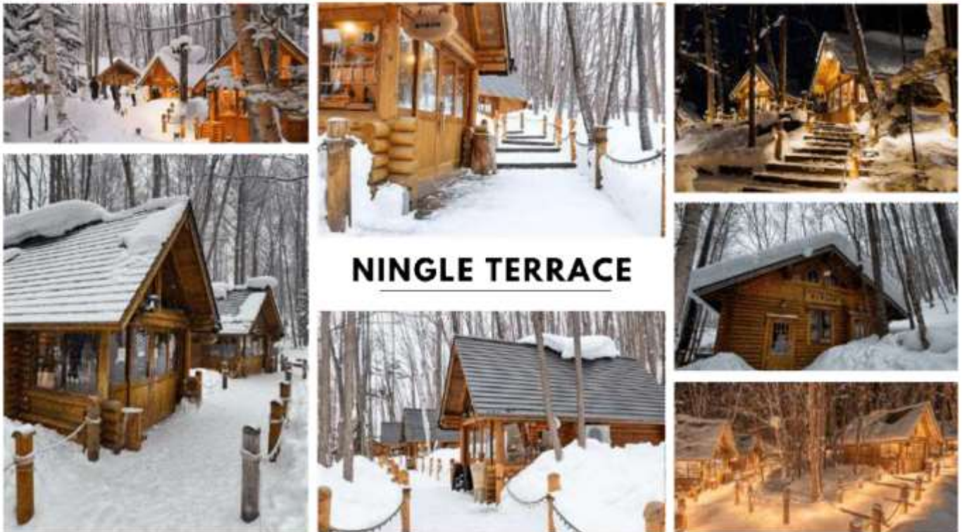
รูปภาพใช้เพื่อประกอบการโฆษณาเท่านั้น

จากนั้นนำท่านสู่ เมืองฟูราโน่ นำท่านสู่ หมู่บ้านเทพนิยายนิงเกิ้ลเทอร์เรส (Ningle Terrace) สัมผัสมนต์เสน่ห์ของหมู่บ้านไม้เล็ก ๆ ท่ามกลางป่าสน ที่ดูราวกับหลุดออกมาจากเทพนิยาย โดยแต่ละหลังคือร้านอาหารฝีมือแฮนด์เมดจากศิลปินท้องถิ่น ทั้งเครื่องประดับ เก๋ยหอม งานไม้ และของที่ระลึกสุดน่ารัก เหมาะสำหรับถ่ายรูป เดินเล่น หรือเลือกซื้อของขวัญสุดพิเศษกลับบ้าน อิสระให้ท่านได้เดินเล่น และถ่ายรูปตามอัธยาศัย